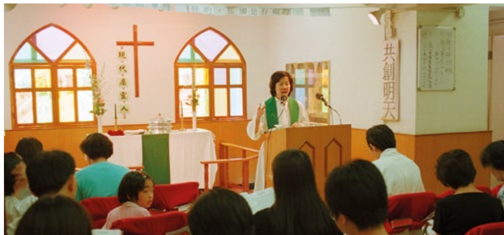
Gottesdienst in der »Joy Lutheran Church« in Hongkong. Hauskirchen wie diese sind meist protestantisch und haben in China über 25 Millionen Mitglieder. In allen christlichen Gemeinden – nicht nur bei den evangelischen – tragen Frauen ganz wesentlich zum Weiterbestehen bei.

religiöse Leben außerhalb des registrierten und kontrollierten Rahmens auszuschalten. Untergrundpriester und -bischofe wurden unter Druck gesetzt, manche zeitweise verschleppt, um sie zu zwingen, Erklärungen zum Prinzip der Unabhängigkeit zu unterschreiben und zur offiziellen Kirche zu wechseln. Soweit wir wissen, ist in einigen ehemals starken Untergrund-Diözesen inzwischen die Mehrheit der Priester, oft unter Zwang, in den offiziellen Teil der Diözese gewechselt. Einige haben aus Enttäuschung und Ratlosigkeit den Priesterdienst verlassen. Die Situation ist für den »Untergrund« existenziell bedrohlich.