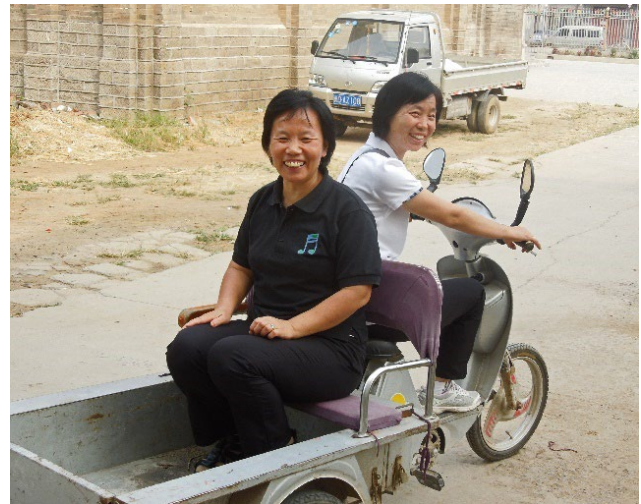
Schwestern auf ihrem Dreiradtransporter (Archivbild)

„Jetzt reicht's! Lasst das sein!“ So oder so ähnlich meldete sich die örtliche Polizei bei der katholischen Gemeinde irgendwo im Norden Chinas. Es war aufgefallen, dass viele der allgegenwärtigen praktischen „Dreiradtransporter“ sonntags oft mit einer Abdeckung zur Kirche kamen – ungewöhnlich! Mittlerweile war also der „Trick“ aufgefallen, mit dem die Gemeinde das Verbot der religiösen Unterweisung von Kindern umgangen hatte: Die Kinder saßen oder lagen auf der Ladefläche der Dreiradtransporter. Bedeckt mit Plastikplanen oder auch nur einem erhöhten Sonnen- oder Regenschutz konnten sie fast unbemerkt von den Überwachungskameras über dem Eingang zum Kirchengelände zur Sonntagsschule fahren. Jetzt war aber Schluss damit! Auch andere Tricks funktionieren nicht mehr. An hohen Feiertagen werden sowieso Polizisten an das Tor zur Kirche gestellt, welche konsequent Minderjährigen den Eintritt verwehren. „Wir lassen es nicht zu, dass jemand uns abhält, unsere Kinder zu Jesus zu bringen!“ meinte eine resolute Frau, die Umstehenden nickten vehement. In einer Mischung von Hilflosigkeit und dem festen Willen, sich nicht unterkriegen zu lassen, suchen sie weiter, wie sie Kinder und Kirche zusammenbringen können. Nicht in allen Gegenden Chinas greift die Polizei diesbezüglich hart durch, aber vor allem in den Hochburgen der katholischen und auch der protestantischen Kirchen wird in der letzten Zeit das Verbot konsequent durchgeführt.