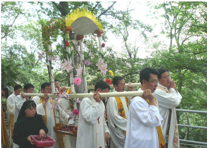
Wallfahrt auf dem Sheshan.