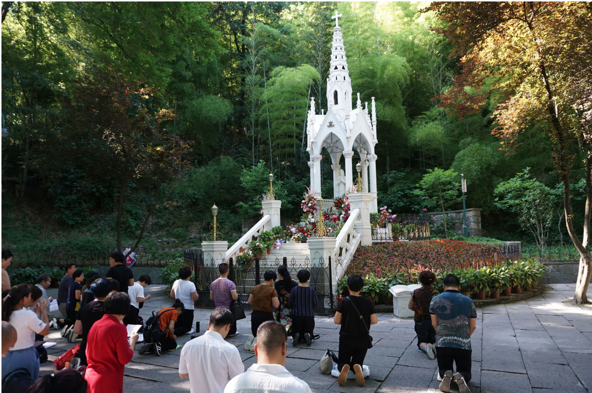
Wallfahrt auf dem Sheshan.

Darum bitten wir durch die Fürbitte Mariens, der Patronin Chinas, und der Heiligen Märtyrer dieses Landes. Amen.