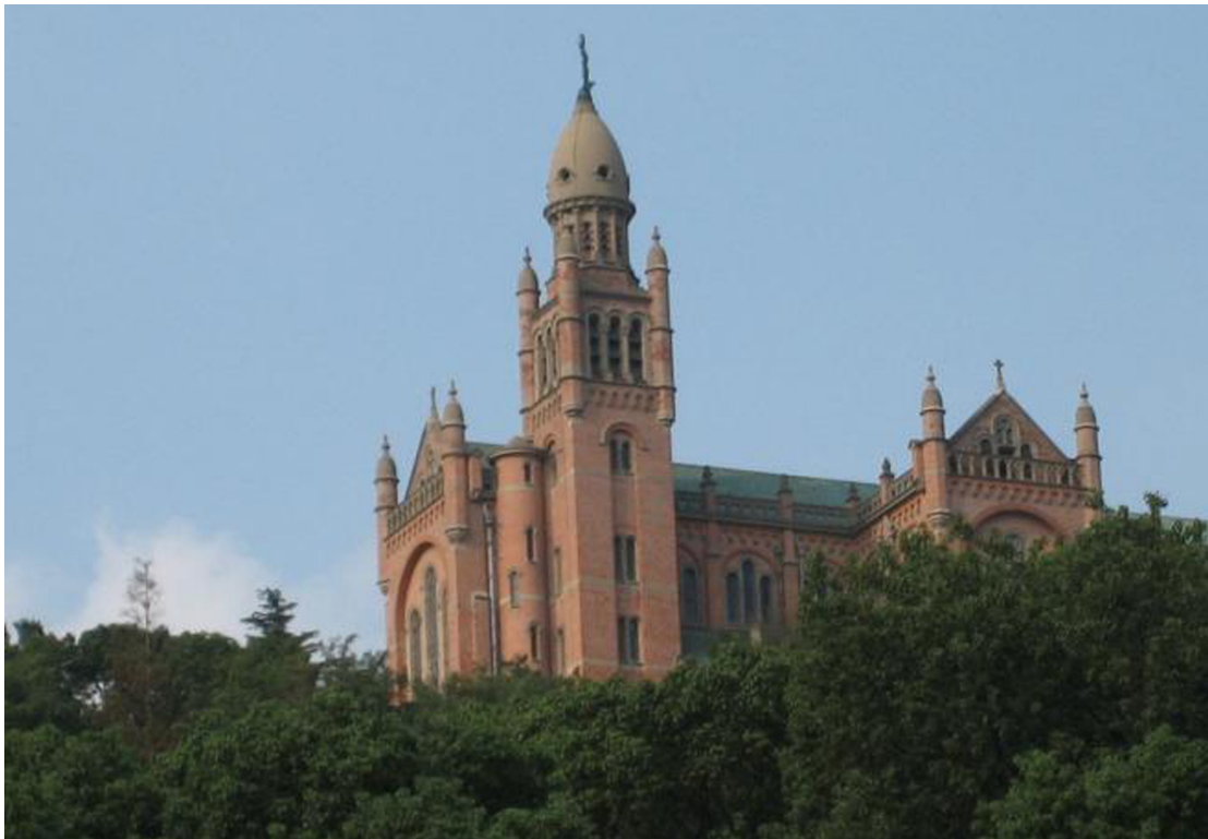
Marienbasilika auf dem Sheshan.

Quellen: Holy Spirit Study Centre (Hong Kong), Diözese Shanghai, Osservatore Romano , Interview China-Zentrum mit Bischof Jin.